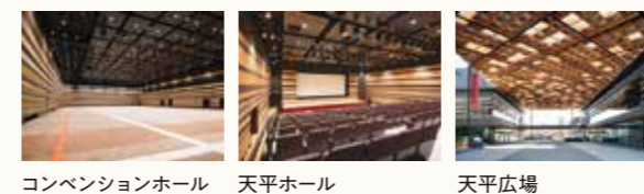
コンベンションホール 天平ホール 天平広場