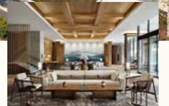
JWマリオット・ホテル奈良