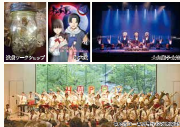
奈良市立一条高等学校吹奏楽部

ならびングプロデュースの手作り雑貨ワークショップの開催やクリエイター・作家の展示販売なども注目。会場内の特設ステージでは、県内で活動している団体・サークル(ミュージック・ダンス)や大和獅子太鼓などの音楽やダンスをお楽しみ下さい。