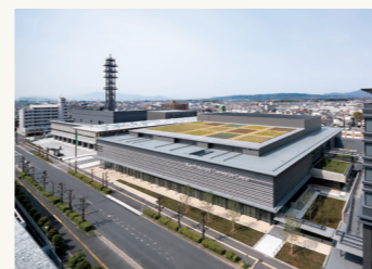
奈良県コンベンションセンター