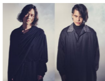
山田将司&菅波米純 (THE BACK HORN)