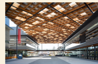
奈良県コンベンションセンター