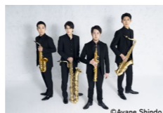
The Quartet "Oiseaux" ザ・クアルテット"オワゾー"