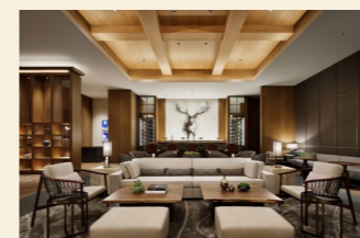
JW マリオット・ホテル奈良