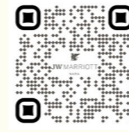
JW マリオット・ホテル奈良 ホームページ

「深森」は、奈良の森が育んできた空気と香り、そして緩やかな時間の流れを体感して頂く森林浴トリートメントです。ヘッド中心のスペシャルケアにて、まるで森林浴をしているかのようなマインドフルな状態へ導きます。森に包まれる感覚に浸り、心と身体がほぐれ、どこか懐かしい安心感に満たされていきます。