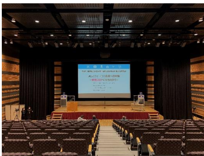
リハーサル時様子